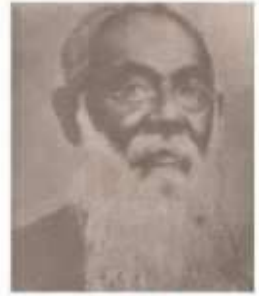
வாசரஸ் (19 ஆம் ஊர்நாண்டு) குறளி ஊல் பகுதியை ஆங்கிலமாக்கியவர்