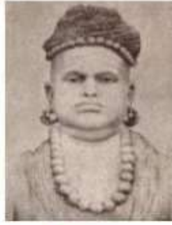
திருவாளுறை கப்பிரமணிய தேசிகர்