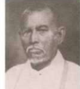
செய்துத்தமிழி பாவலர் 1876 - 1950 சதாவதாமி, பெரும்கவிஞர்