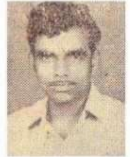
புலவர் அகரன் தனித்தமிழ்ப் படைப்பாளி