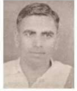
வித்துவான் க. வெள்ளையாரானல்