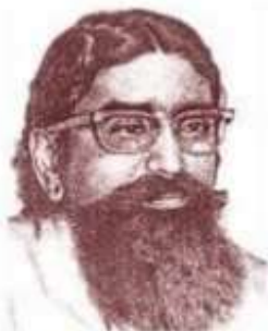
பெருஞ்சித்திரனார் தனித் தமிழ் அறிஞர் தென்மொழி இதுமார்