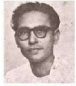
கவிஞர் வாணிதாசன் 1915 - 1974 தமிழ்நாட்டுத் தாகூர் எனப் பொற்றம்பலும் நற்கவிஞர்