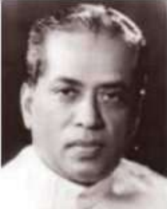
தனிநாயகம் அடிகளார் ஈழம் கண்ட தனிப்பெரும் தமிழ்த் துறவர்