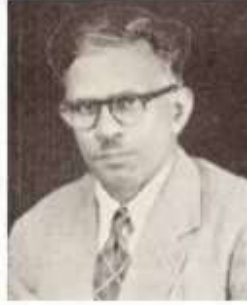
எல். தாக., பி.ஏ.,எம்.டி.,