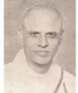
வித்துவான் மு. அருணாசலம் பிள்ளை