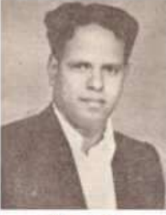
வித்துவான் தனிகை உலகநாதன்