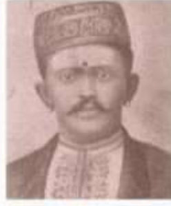
பொ. பாண்டித்துரைத் தேவர் 1867 - 1911 நான்காம் தமிழ்ச் சங்கம் நவமுறைக் கண்டவர்