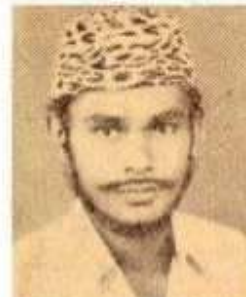
சக்திவேலன் தமிழ்க் கவிஞர்