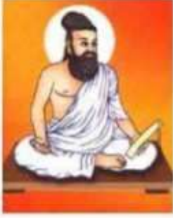
திருவள்ளுவர் திருக்குறள் நூல் எழுதியவர்