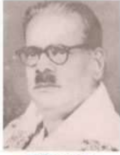
பாரதிதாசனார் 1891 - 1964 புரட்சிக் கவிஞர்