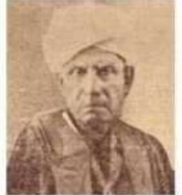
உ.வே. சாரிநாதனார் 1855 - 1942 தமிழ் றூல் பதிப்பதில் தலைவராய் புகழ் கண்டவர்