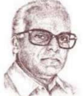
சாவல இளந்திரையன் மணிவீறு கண்டவர் தமிழ் வேழமாய் நிமிர்ந்தவர்