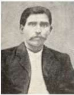
ஓவியப் புலவர் செல்வையார்