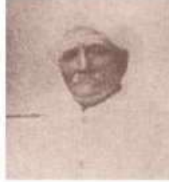
ஆ. சங்கரவேலனார் 1855 - 1931 அபிதான சிந்தாமணி அழகுறப் படைத்தவர்