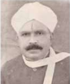
ஆ. கார்யையார் 1889 - செந்தாப் புலவர் சிறப்புரை வித்தகர்