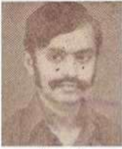
பதுமன் காத்திராமம் தனித்தமிழ்ப் பாவனர்