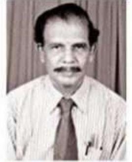
செங்கை ஆழியான் ஈழத்துக் கவிஞர்