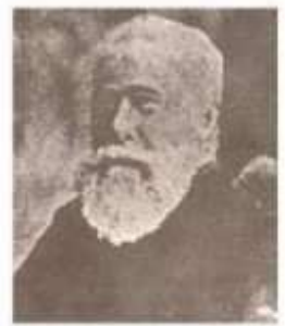
ஜி.டி.பொப் 1820 - 1907 கிருத்தவர், தாங்கியார், கிருவாசல் ஆங்கிலத்தின் பெயர்த்தவர்