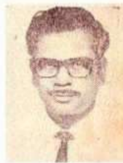
தமிழ்ச்சித்தன் வல்லமை இதழ் படைப்பாளி தனித் தமிழ் ஆர்வலர்