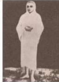
இராமலிங்க அடிகளார் 1823 - 1874 திருஅருட்பா தந்தவர்