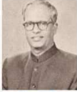
மு. வரதராசனார் 1912 - 1974 நீத்தமிழ்க் குறளுக்குத் தெளிவுரை கண்டவர்