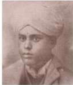
வி. கோ. சூரியநாராயணனார் 1870 - 1903 பரிமாரி கலைநூலி நாடகத் தமிழ் வளர்த்தவர்