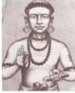
சியலூன முனிவர் - 1785 தொல்காப்பிய குத்திரவிருத்தி யாத்தவர்