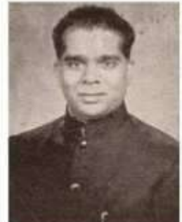
க. பெருமாள்., எம்.ஏ.,