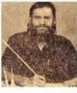
உலகக் குடிமகன் தேளிதமிழ்க் பாவனர்