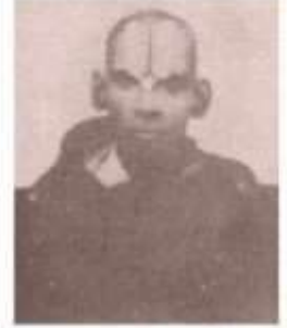
நாராயணனார் 1861 செந்தமிழ் பதிப்பாசிரியர் மாறவல்லினாரும் பதிப்பாசிரியர்