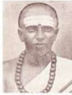
பண்டித் தி.பா. சிவராம் பிள்ளை