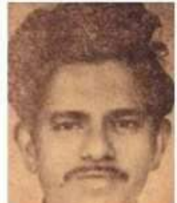
சீராளன் வல்லமை இதழ் படைப்பாளி