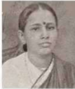
தனித்தமிழ்த் திருவாட்டி திருவாரங்க நீலாம்பிகையம்மையார்