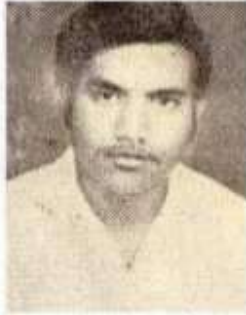
எ.க.சாந்தமுர்த்தி செய்பாறு கவிஞர்