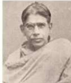
மறைமலையடிகள் 1876 - 1950 தனித்தமிழ் இயக்கத்தின் தாணைத் தலைவர்