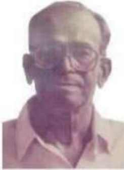
திருளாயித் தென்றல் தி.க.சிவசங்கரன்