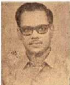
கோ. மா. இரா தனித் தமிழ் ஆர்வனர்