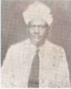
வித்துவானு பாலாரர் கண்ணப்ப முதுவியார்