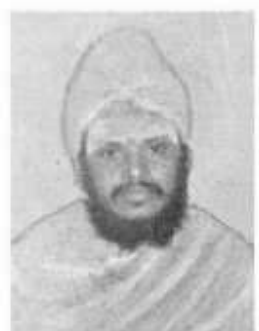
தவத்திரு குன்றக்குடி அரக்கனார்