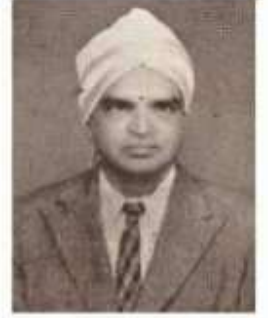
வித்துவான் வி. குஞ்சிநாதமையர்