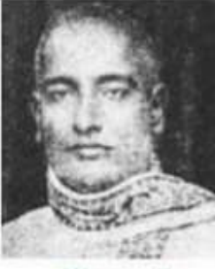
நடேசையர் மலையல மக்களுக்காகத் தொடர்ந்து இயங்கியவர்