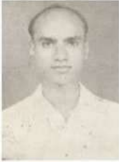
பக்தவத்சலம் ( முத்தமிழ்மணி )