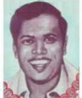
மக்கள் கலிஞர் பட்டுக்கோட்டை கல்யாணசுந்தரம்