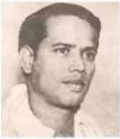
மட்டுமேயே கல்யாணகந்திரம் 1930 - 1959 மக்கள் கவிஞராய் மலர்ந்து புகழ்மணம் பரப்பியவர்