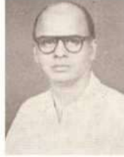
வித்துவான் ச. தண்டபாணி தேசிகர்