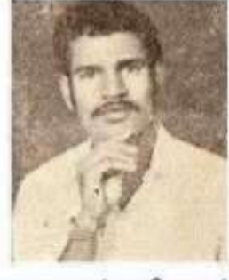
கருமலைத் தமிழாழன் தனித்தமிழ்ப் படைப்பாளி