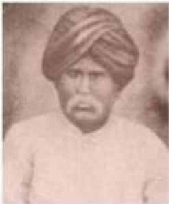
மாமூரம் ச.வேதநாயகர் 1826 - 1889 முதல் நாவலை ஆக்கியவர்