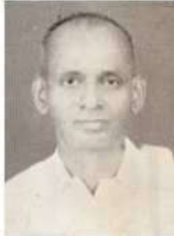
வித்துவான் வீ. குமாரசாமி ஐயர்