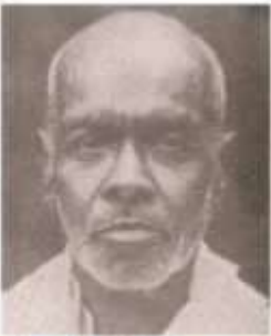
கவிமணி தேசியவிநாயகனார் 1876 - 1954 சிறுவர்க்கெதிர கவிதை ஆக்கிய குழந்தைக் கவிஞர்