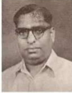
வித்துவான் க. சிதம்பரதாணு