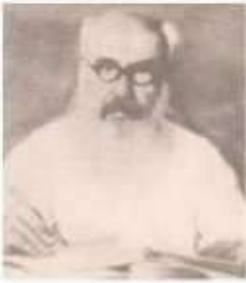
பாராக பாதிரியார் ( 19 ஆம் ஊர்நாண்டு ) சிந்துமெளி நாகரிகம் திராவிட நாகரிகம் என திருவிவரம்