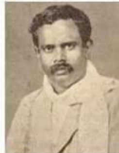
பாவாணர் தனித்தமிழ் இயக்கம் கண்டவர் தெளித்தமிழ் ஊக்கியவர்