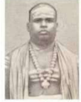
புகழ் முத்துசாமிப் பிள்ளை