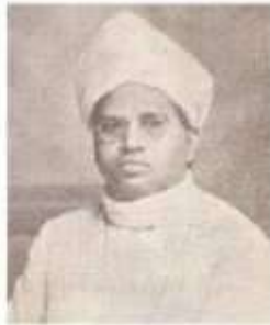
பாரிப்பாக்கம் கண்ணப்ப முதுவிபார்