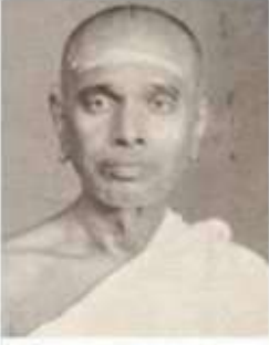
டாக்டர் கனியர் இ.மு. சுப்பிரமணிய பிள்ளை