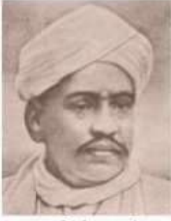
வ.உ.சிதம்பரனார் 1872 - 1936 கப்பல் ஓட்டிய தமிழர் குறாளுரை கண்டவர்