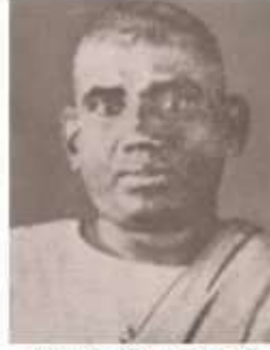
கவாமி விபுலானந்தர் 1892 - 1947 யாழ்நகர் படைத்து இசைத்தமிழ் வளர்த்தவர்