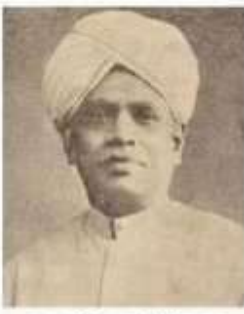
க. ந.டேச பிள்ளை கவிப்பாளர், சகுந்தலை யென்பா றூமை இயற்றியவர்