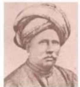
சி.வே. தாமோதரனார் 1832 - 1901 கவித்தொகை, ஜனமணிப்பய கவிஞர்ப் பதிப்பித்தவர்