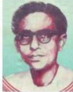
கவிஞரேறு வாணிதாசன் (22,7,1915 - 7,8,1974)