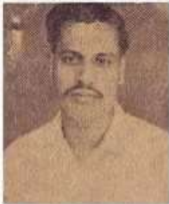
அண்ணாமலை தனித்தமிழ்ப் பாவனர்