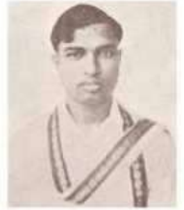
வித்துவான் பா. சொக்கலிங்கம்