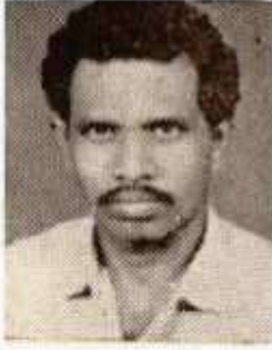
மு.க. தங்கவேலன் வானியம்பாடி கவிஞர்