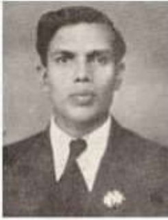
வித்துவான் ந. சேதுரகுநாதன்