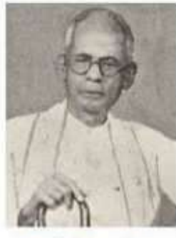
ஓவியப் புலவர் செகதநாதாச்சாரியர்