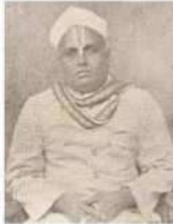
வித்துவான் ஆ. பூவராகம் பிள்ளை