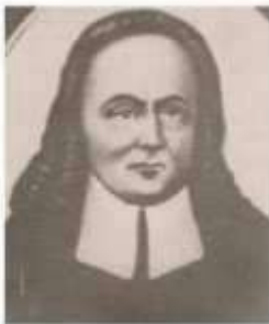
பெப்ரீசியன் 1711 - 1791 முதல் தமிழ்-ஆங்கில-ஆங்கில- -தமிழ் அகராதி தொகுத்தவர்