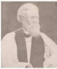
காலிடுவெல் 1814 - 1891 திராவிட மொழிகளின் ஒப்பியல்களும் கண்டவர்