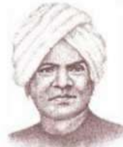
அய்யாத்திதாசப் பண்டிதர் தமிழ் உளர்வோடு நிமிர்ந்தவர் முடுக்கப்பட்டவருக்காக உழைத்தவர்