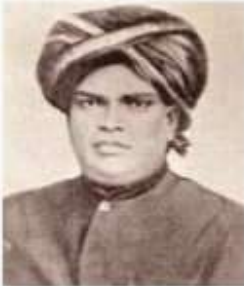
பேரா. பெ. கந்தரனார் 1855 - 1897 மனோமணிபம் றூல்