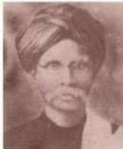
சு.ஏ. கிருஷ்ணனார் 1827 - 1900 இரட்சணிய யாத்திரிகம் எழிலுடைய படைத்தவர்