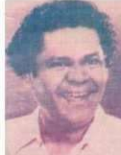
மக்கல் கலயலர் கலைவாணர் (29,11,1908 - 30,8,1957)