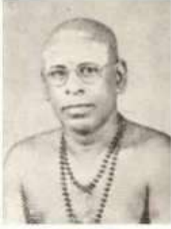
அழகராடிகள் ( இளவழகனார் )